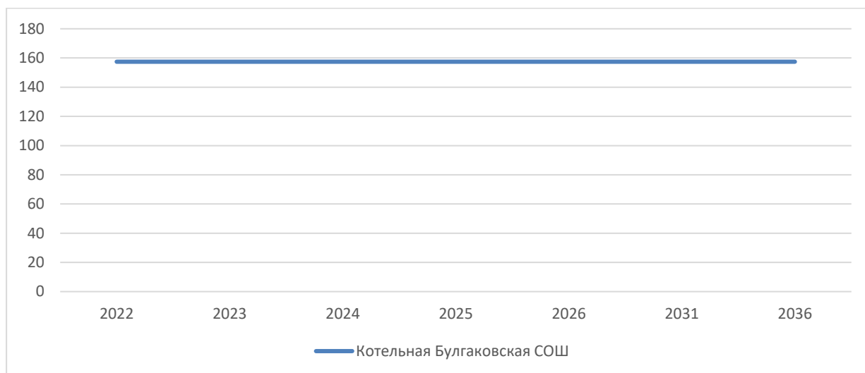
Рисунок 1. Динамика НУР топлива на период 2022-2036 г.г