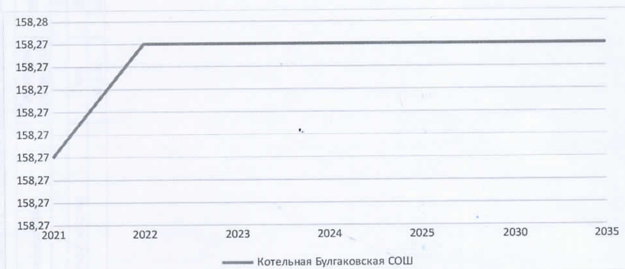
Рисунок 1. Динамика НУР топлива на период 2021-2035 г.г

Прогнозы по отпускаемой тепловой энергии и топливопотреблению рассматривались по котельным, которые задействованы в схеме теплоснабжения, со следующим допущением: производство тепловой энергии ведомственной котельной остаётся на уровне базового года. Перспективное значение удельных расходов топлива на производство тепловой энергии приведено на рисунке 1 и в таблице 11.